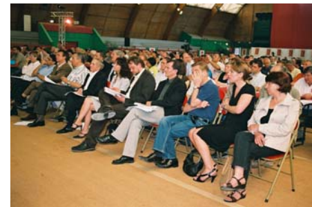
Les invités et les délégués pendant le discours de Jean-Pierre Chevènement

A partir de ces orientations, nous proposons que tou-