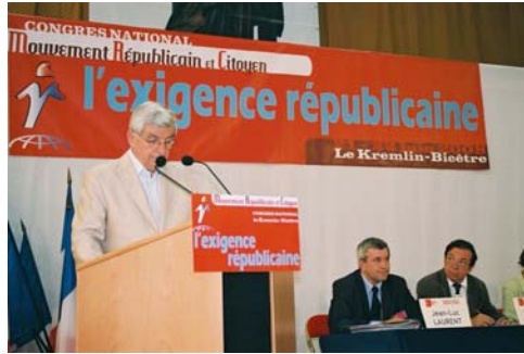
Elu Président du MRC, Jean-Pierre Chevènement conclut le congrès du Kremlin-Bicêtre

Pour porter cette ambition de changement, la gauche